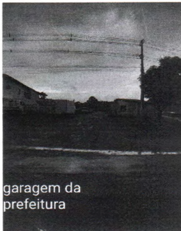
garagem da prefeitura