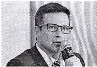
Roberto Campos Neto não confirmou declaração de Bolsonaro

Ele afirmou também que a economia está caminhando para um processo de tokenização (em referência aos tokens, criptomoedas com lastro em ativos reais) em escala global, e que está nos planos da autoridade monetária iniciar mais a frente uma integração das novas frentes de tecnologia lançadas nos últimos anos, como o Pix e o Open Finance. "Estamos entrando em uma fase de tecnologia muito inte-